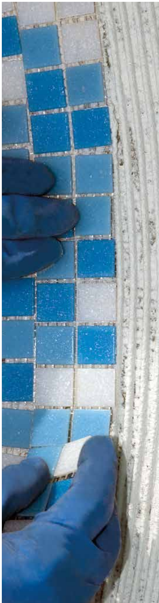
Posa di mosaico vetroso 2x2 in piscina con AS 100 più AS LATEX

AS LATEX è un lattice da miscelare, puro o diluito in rapporto 1:1 con acqua, con AS 100, al fine di soddisfare i requisiti definiti dalla norma EN 12004 per le seguenti classificazioni: